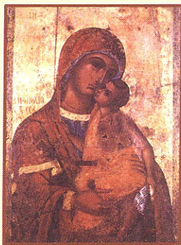
Παναγία η Φιλοχιώτισσα (1570) Η Εικόνα που εκπροσώπησε την Κύπρο 2 φορές στο εξωτερικό σε διεθνείς εκθέσεις Βυζαντινών εικόνων. Η τελευταία που ζωγραφίστηκε πρίν την Τουρκοκρατία.