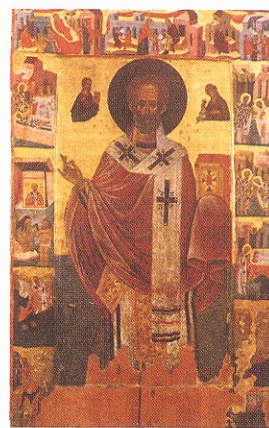
Άγιος Νικόλαος του 1528.

Απο το μοναστήρι Αγ. Νικολάου το οποίο ελειτουργούσε μέχρι τέλος του 1800. Σε καταγραφή των μοναστηριών που έγινε το 1574 ήταν το 8 ο κατα σειρά μοναστήρι στη Πάφο. (Σύμφωνα με τον αριθμό μοναχών)