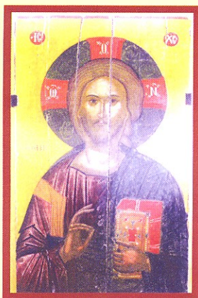
Ιησούς Χριστός (1400) Ο Σωτήρ του Κόσμου