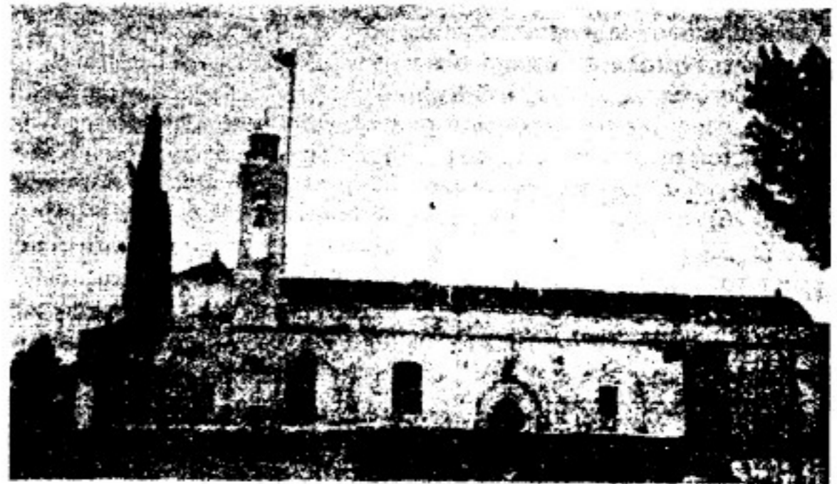
Η Χρυσελευούσα τή 1928.