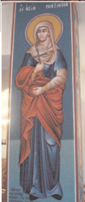
Η αιογραφία της Αγίας Ναταλίας

Ο ναός είναι κτισμένος σε οικόπεδα τα οποία έκανε δωρεά η οικογένεια Ν. Γ. Ιακωβίδου, που ανέλαβε εξ ολοκλήρου και τα έξοδα για την ανέγερσή του. Τα εγκαίνια τελέστηκαν στις 29 Απριλίου 1965 από τον τότε Αρχιεπίσκοπο Κύπρου Μακάριο Γ'. Ο Μακαριότατος δώρισε στην εκκλησία τον Αρχιεπισκοπικό θρόνο και το Ιερό Ευαγγέλιο. Από τότε μέχρι σήμερα η εκκλησία λειτουργεί κανονικά με επιτροπή και δικό της ιερέα.