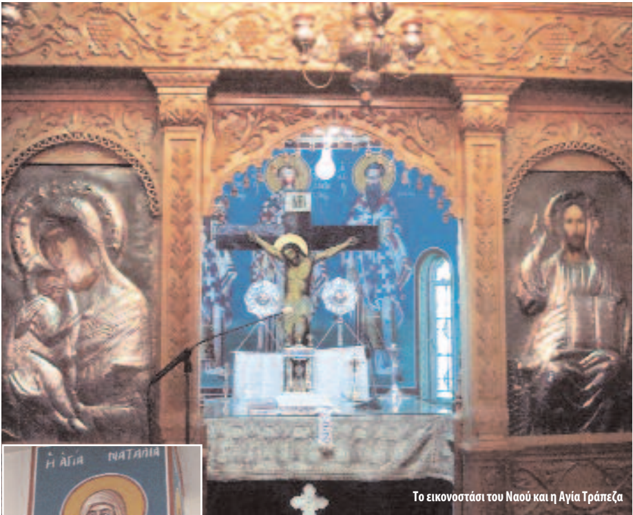
Το εικονοστάσι του Ναού και η Αγία Τράπεζα