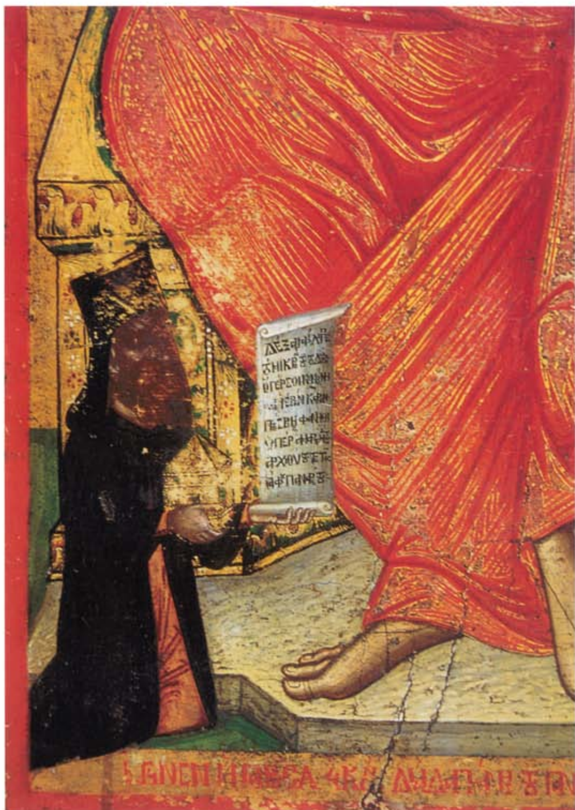
Ό Άγιος Πανάρετος. Εικόνα του Άγιου Φιλίππου του ναού του Τιμίου Σταυρού, Όμοδος. 1773.