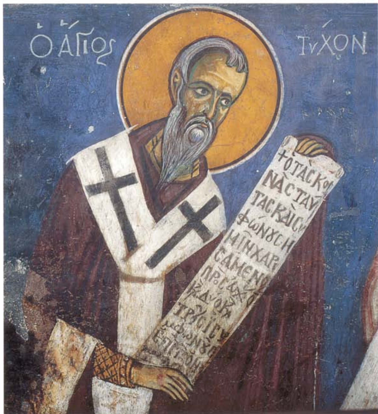
Ο Άγιος Τύχων. Τοιχογραφία του ναού της Παναγίας του Άραξος. 1192.