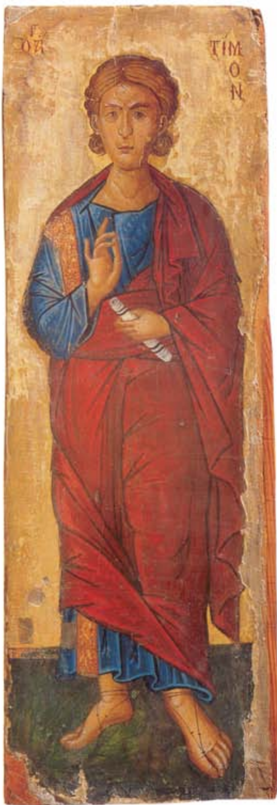
Ὁ Ἅγιος Τίμων. Εἰκόνα τοῦ ναοῦ τοῦ Εὐαγγελισμοῦ, Βάσα (Κοιλανίου), 16ος αἰώνας.