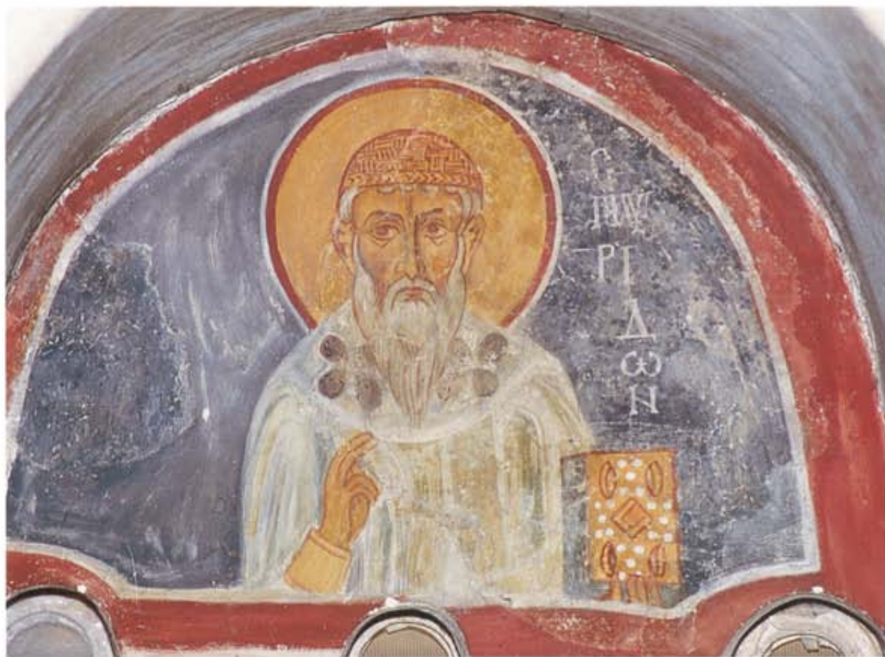
Ὁ Ἅγιος Σπυρίδων. Τοιχογραφία τοῦ Καθολικοῦ τῆς Μονῆς τῆς Παναγίας Ἀμασοῦ, Μονάχι. Ἀρχές τοῦ 12ου αἰώνα.