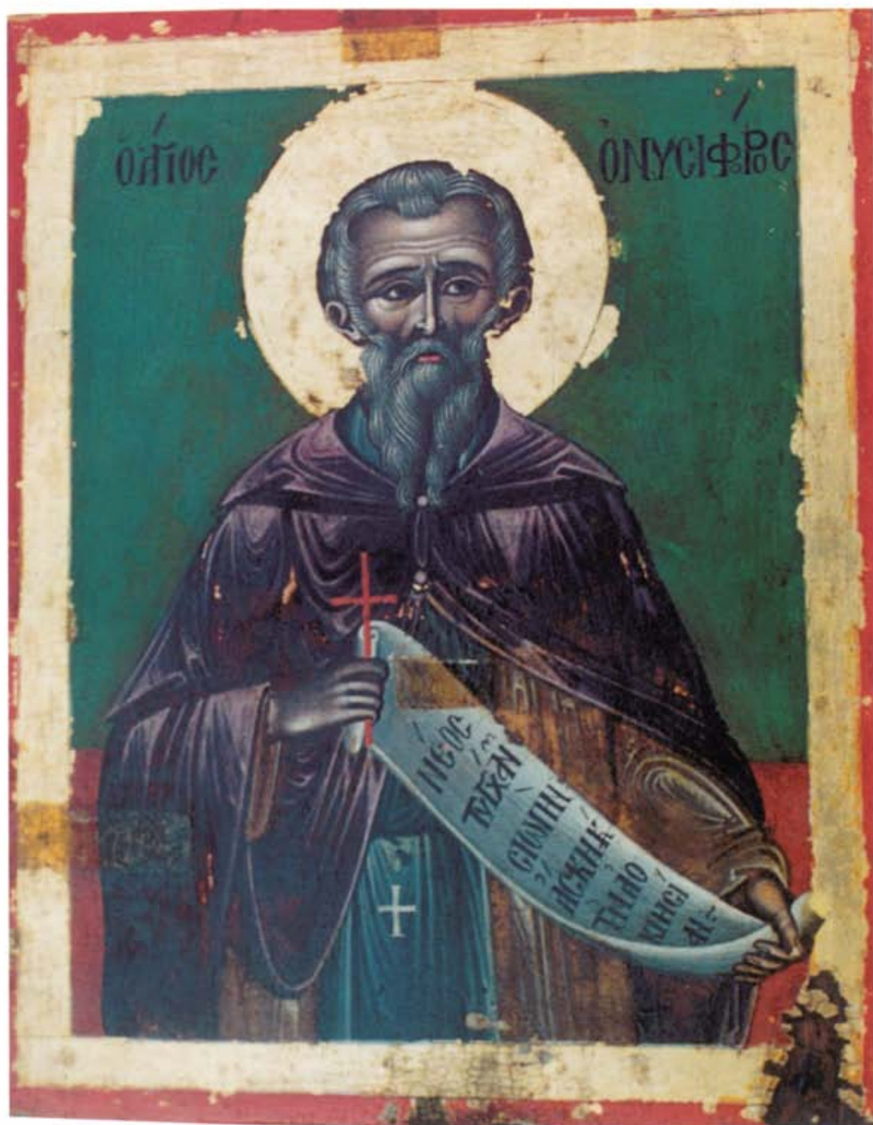
Ὁ Ἅγιος Ὀνησιφόρος. Εἰκόνα τοῦ ναοῦ τοῦ Ἁγίου Ὀνησιφόρου, Ἀναρίτα. 19ος αἰώνας.