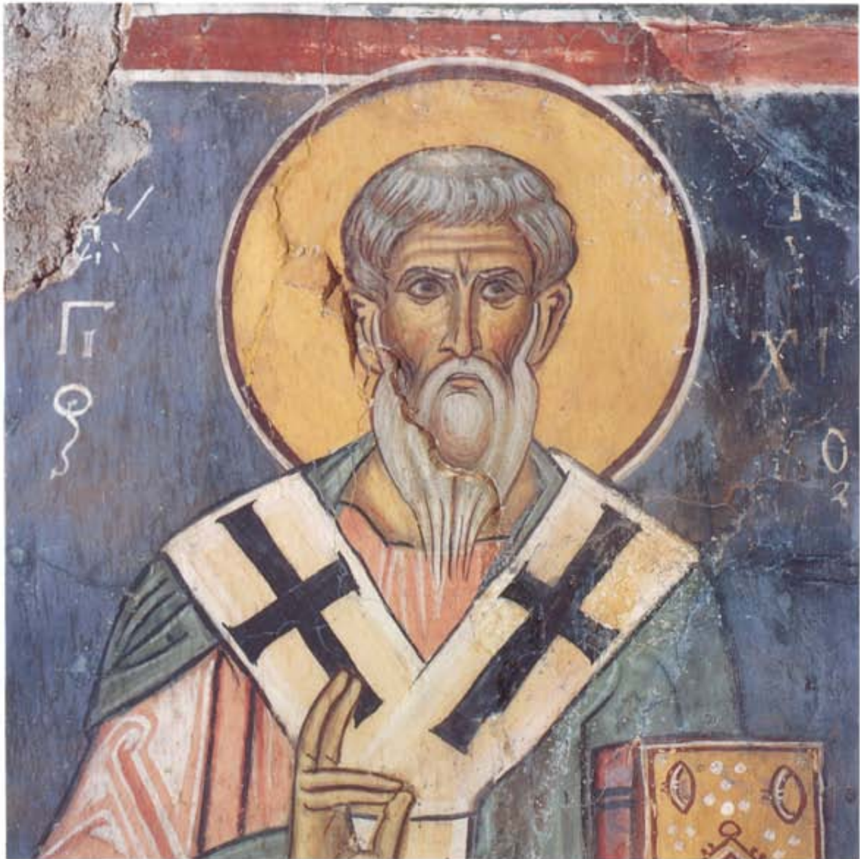
Ὁ Ἅγιος Τυχικός. Τοιχογραφία τοῦ ναοῦ τῆς Παναγίας τῆς Ἀσίνου. 1105/1106.