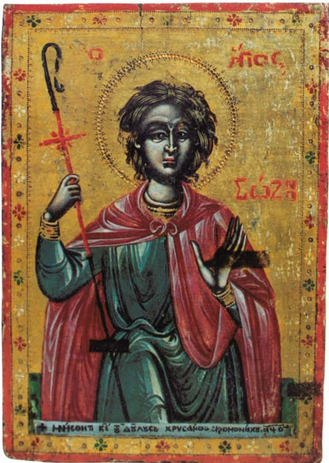
Ὁ Ἅγιος Σώζων. Εἰκόνα τῆς Μονῆς τῆς Παναγίας Χρυσορροιάτισσας. 1770.