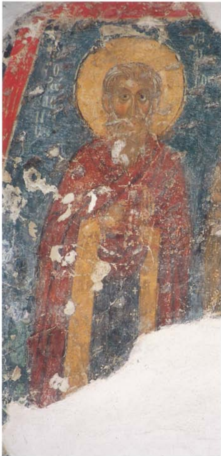
Ὁ Ἅγιος Σωζόμενος. Τοιχογραφία τοῦ Ἀσκητηρίου τοῦ Ἁγίου Σωζομένου. Ἅγιος Σωζόμενος, 10ος αἰώνας(;).