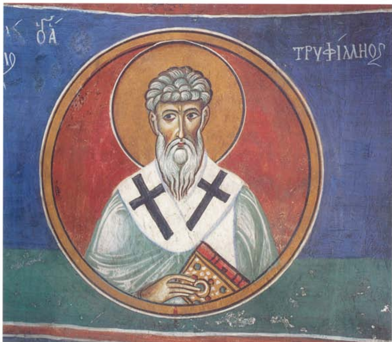
Ὁ Ἅγιος Τριφύλλιος. Τοιχογραφία τοῦ ναοῦ τῆς Παναγίας τοῦ Ἄρακος, 1192.