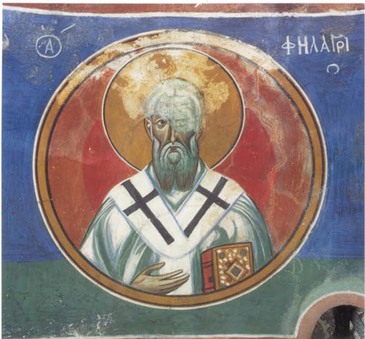
Ὁ Ἅγιος Φιλάγιος. Τοιχογραφία τοῦ ναοῦ τῆς Παναγίας τοῦ Ἄρακος. 1192.