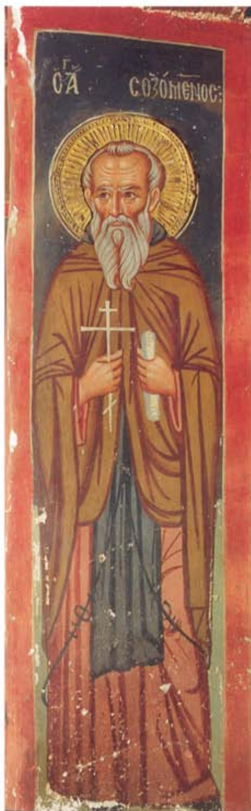
Ο Άγιος Σωζόμενος. Τοιχογραφία του ναού του Τιμίου Σταυρού του Άγιασμάτι. 1494(·).