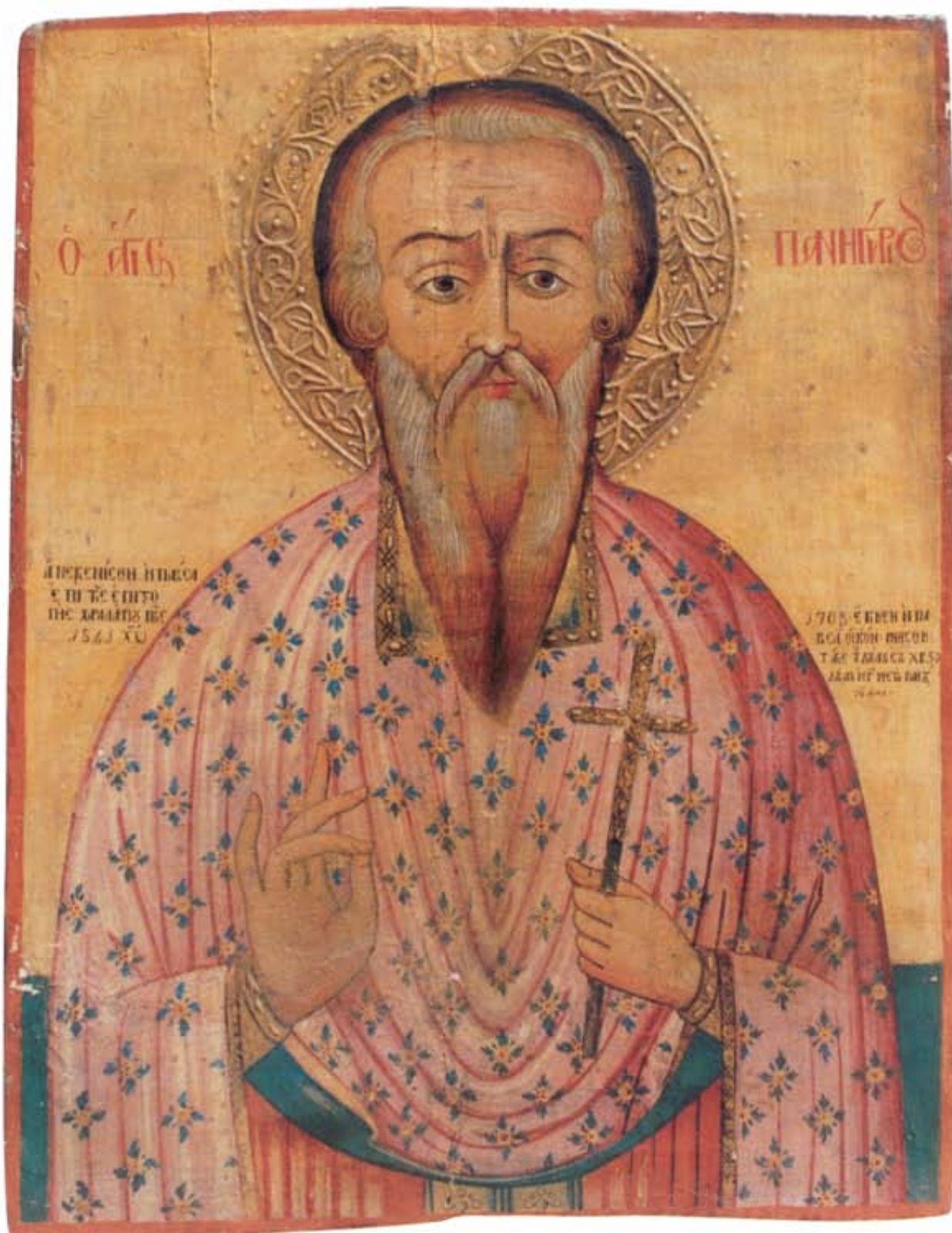
Ο Άγιος Πανηγύριος. Εικόνα του ναού της Παναγίας, Μαλούντα. 1708 με επιζωγράφιση του 1841.