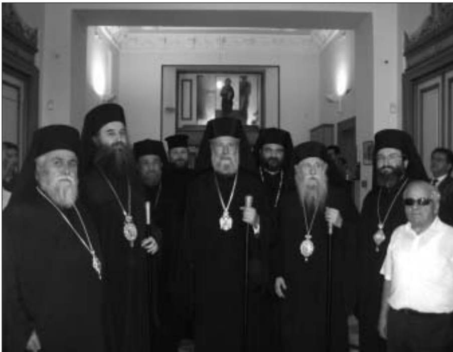
Ὁ Μακαριώτατος στή Μητρόπολη Ἡλείας στὸν Πύργο.

καί ὡς ἀνταπόδοση σέ ὅλα ἐκεῖνα τά ὅποια οἱ Ἕλεῖοι, καί οἱ ὑπόλοιποι Ἑλληνες ἀδελφοί, ἔκαναν, θέλοντας νά βοηθήσουν τοὺς Κυπρίους ἀδελφούς τους ἀμέσως μετὰ τὰ τραγικά γεγονότα, πού ἐπέφερε τό πραξικόπημα καί ἡ τουρκική εἰσβολή τοῦ 1974. Συνεχίζοντας, ὑπογράμμισε μέ ἔμφαση καί τά ἑξῆς: «Εἴμεθα ἓνα ἔθνος καί δέν μπορούμε νά μένουμε ἀπαθείς. Οὔτε ὁ ἀπανταχοῦ γῆς Ἑλληνισμός μπορεῖ νά παραμένει ἀπαθής μπροστά στήν ἀδικία, πού συνεχίζεται γιά 34 χρόνια εἰς δάρος