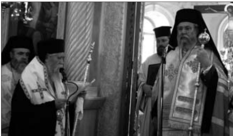
Ό Μητροπολίτης Ήλείας καί Όλάνης Γερμανός προσφωνεί τόν Μακαριώτατο μετά τό Τρισάγιο στόν ι. ναό Αγ. Νικολάου Πύργου.

Άκολούθως, ή αυτοκινητοπομπή κατευθύνθηκε στό κέντρο τής πόλεως του Πύργου, όπου κλήρος καί λαός περίμεναν τήν άφιξη του Μακαριωτάτου στά προπύλαια του Μητροπολιτικού ναού Αγίου Νικολάου. Ό Μακαριώτατος Αρχιεπίσκοπος Κύ-