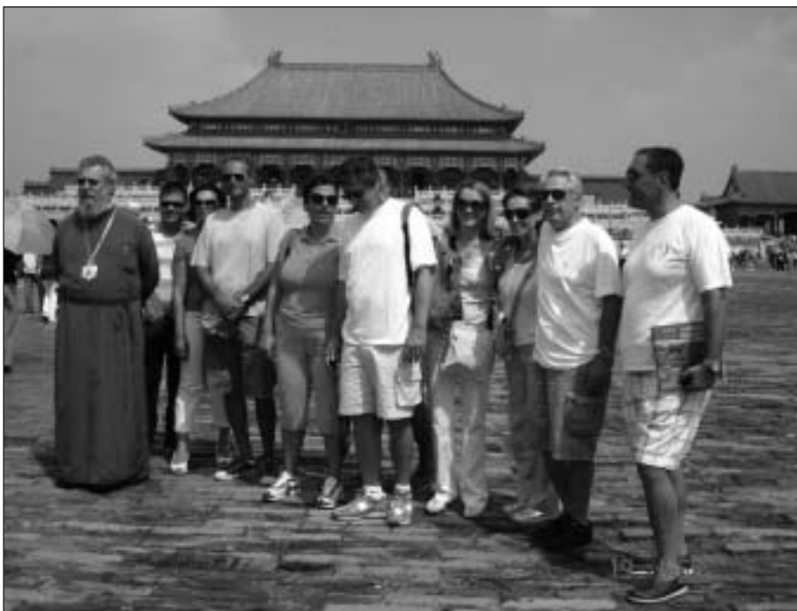
Ὁ Μακαριώτατος μέ ομάδα ἐπισκεπτῶν στό Πεκίνο.