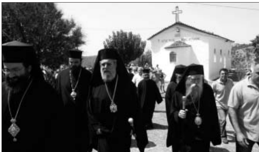
Ὁ Μακαριώτατος περιοδεύει στίς πληγεῖσες περιοχές τοῦ Νομοῦ Ἡλείας.

Ἡ περιοδεία ὀλοκληρώθηκε μέ ἐπίσκεψη στήν Ἀρχαία Ὀλυμπία. Ἐκεῖ ὁ Μακαριώτατος εἶχε τήν εὐκαιρία νά δεῖ τό μέγεθος