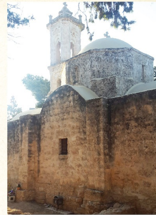
Ο αρχαίος ναός Μεταμορφώσεως του Σωτήρος (12 ος αι.) κτισμένος πάνω στα θεμέλια της Βασιλικής του 4 ου αι., Σωτήρα Αμμοχώστου.