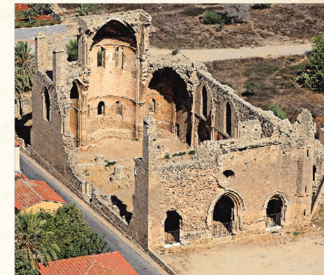
Άγιος Γεώργιος των Ελλήνων, Αμμόχωστος

Ο Καθ. Σταύρος Σ. Φωτίου γεννήθηκε στη Λεμεσό το 1959. Σπούδασε Παιδαγωγική και Θεολογία στη Λευκωσία και την Αθήνα. Είναι διδάκτωρ Θεολογίας της Θεολογικής Σχολής του Πανεπιστημίου Αθηνών και σήμερα Καθηγητής Θεολογίας και Διδακτικής των Θρησκευτικών στο Τμήμα Επιστημών της Αγωγής του Πανεπιστημίου Κύπρου. Είναι επίσης συγγραφέας-Καθηγητής Μεταπτυχιακών Σπουδών του Ελληνικού Ανοικτού Πανεπιστημίου. Έχει γράψει δεκατρία βιβλία και εκδώσει σαράντα πέντε συλλογικούς τόμους. Το 1991 τιμήθηκε με Κρατικό Βραβείο για το βιβλίο του «Αλλοτρίωση και αυτογνωσία».