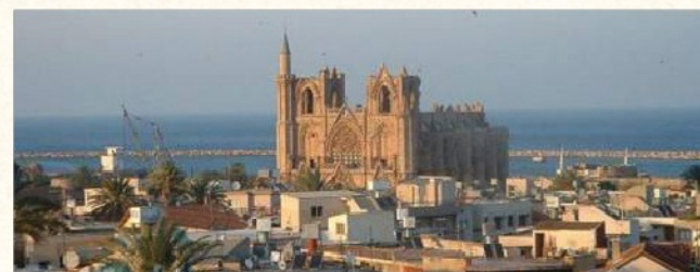
Καθεδρικός Ναός Αγίου Νικολάου, Αμμόχωστος

Ο π. Πορφύριος είναι διδάκτωρ της Θεολογικής Σχολής του Πανεπιστημίου Θεσσαλονίκης, Αναπληρωτής Καθηγητής Δογματικής Θεολογίας και Κοσμητορας της Θεολογικής Σχολής «Άγιος Ιωάννης ο Δαμασκηνός» του Πανεπιστημίου Balamand στον Λίβανο (Πατριαρχείο Αντιοχείας). Έχει δημοσιεύσει μονογραφίες και άρθρα στα αραβικά, τα ελληνικά, τα αγγλικά και άλλες γλώσσες.