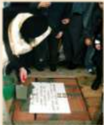
ΘΕΜΕΛΙΟΣ ΛΙΘΟΣ 2002