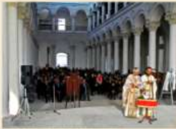
ΠΡΩΤΗ ΛΕΙΤΟΥΡΓΙΑ - 2008