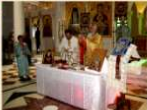
ΛΕΙΤΟΥΡΓΙΑ Αγ. ΙΑΚΩΒΟΥ