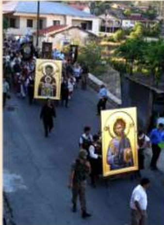
ΥΠΟΔΟΧΗ ΙΕΡΩΝ ΕΙΚΟΝΩΝ 2009