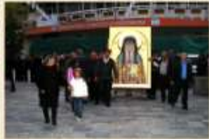
ΥΠΟΔΟΧΗ ΙΕΡΩΝ ΕΙΚΟΝΩΝ 2009