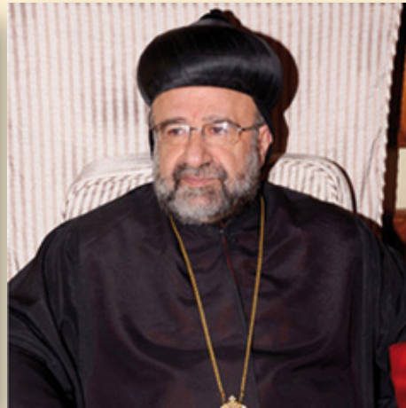
Ο συρορθόδοξος Μητροπολίτης Χαλεπίου Γιοχάνα Ιμπραχίμ

Αμφότεροι απήχθησαν από την Αλ Καϊντα τον Απρίλιο του 2013 και πιθανότατα δολοφονήθηκαν κατά τρόπο εγκληματικό. Οι χριστιανικοί λαοί της Ευρώπης αντέδρασαν χλιαρά με τυπικές ανακοινώσεις διαμαρτυρίας. Ίσχυσαν και πάλι οι προφητικοί λόγοι του Ιησού: