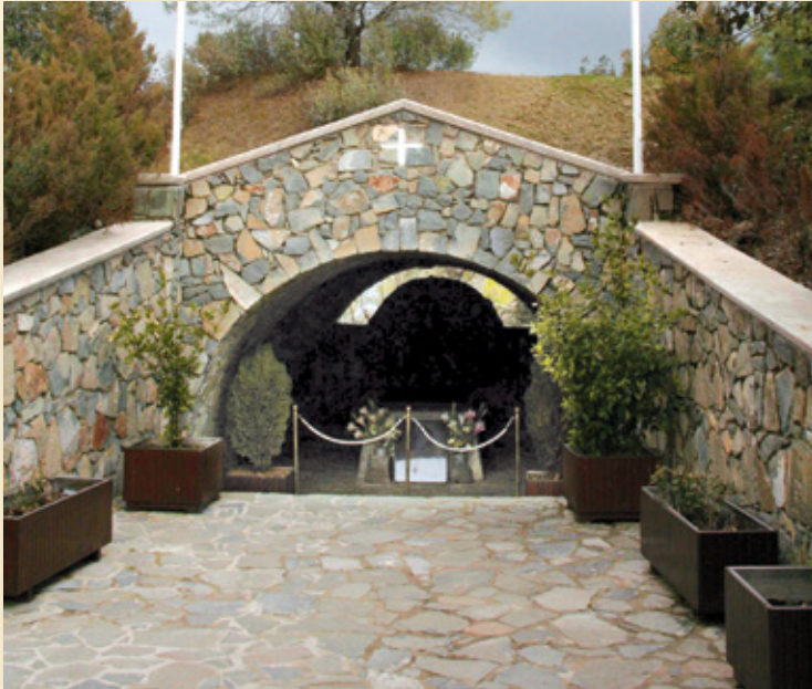
ΤΟ ΘΡΟΝΙ ΤΟΥ ΚΥΚΚΟΥ. ΕΔΩ ΑΝΑΠΑΥΕΤΑΙ ΤΟ ΣΚΗΝΩΜΑ ΤΟΥ ΕΘΝΑΡΧΗ ΜΑΚΑΡΙΟΥ