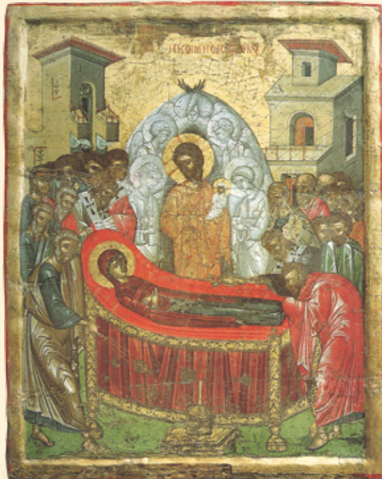
Η ΚΟΙΜΗΣΗ ΤΗΣ ΘΕΟΤΟΚΟΥ. ΦΟΡΗΤΗ ΕΙΚΟΝΑ ΑΠΟ ΤΗΝ ΕΚΚΛΗΣΙΑ ΤΙΜΙΟΥ ΣΤΑΥΡΟΥ ΠΕΔΟΥΛΑ