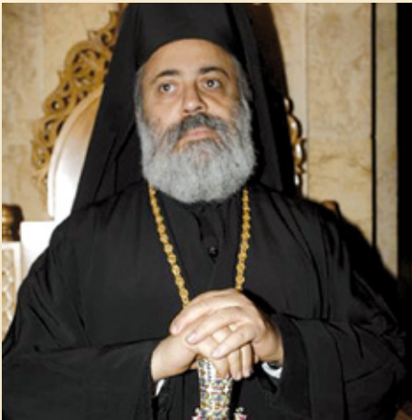
Ο ελληνορθόδοξος Μητροπολίτης Χαλεπίου Παύλος

Ξερίζωμα των Χριστιανών της περιοχής αποτελεί επίσης μια καταστροφή και για τους Μουσουλμάνους. Είναι αυτοί στους οποίους θα μείνει το έργο της οικοδόμησης μιας πιο ανεκτικής και δημοκρατικής(;) κοινωνίας στον απόηχο αυτών των βαρβαροτήτων. Σήμερα οι τζιχαντιστές αφαιρούν το είδος του πλουραλισμού που αποτελεί το θεμέλιο για κάθε πραγματικά δημοκρατική δημόσια ζωή. Ένα από τα συνθήματα της Αραβικής Άνοιξης ήταν ότι οι πολίτες θέλουν να βάλουν τέλος στην τυραννία. Αλλά, ο μόνος διαρκής εγγυητής των πολιτικών δικαιωμάτων είναι το είδος της κοινωνικής και θρησκευτικής πολυμορφίας που οι ριζοσπάστες Μουσουλμάνοι της περιοχής βρίσκονται στην διαδικασία να εξαλείψουν.