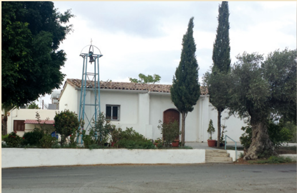
ΠΑΝΑΓΙΑ ΧΡΥΣΟΚΟΥΛΟΥΡΙΩΤΙΣΣΑ (ΠΑΡΕΚΚΛΗΣΙ ΝΑΟΥ ΑΓΙΑΣ ΠΑΡΑΣΚΕΥΗΣ)