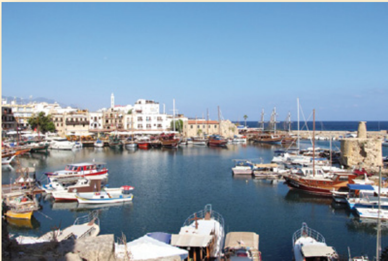
ΤΟ ΛΙΜΑΝΑΚΙ ΤΗΣ ΚΕΡΥΝΕΙΑΣ

ΤΟ ΘΕΪΚΟ ΣΟΥ ΧΑΜΟΓΕΛΟ ΚΑΙ ΤΟ ΘΕΛΚΤΙΚΟ ΣΟΥ ΜΕΓΑΛΕΙΟ!