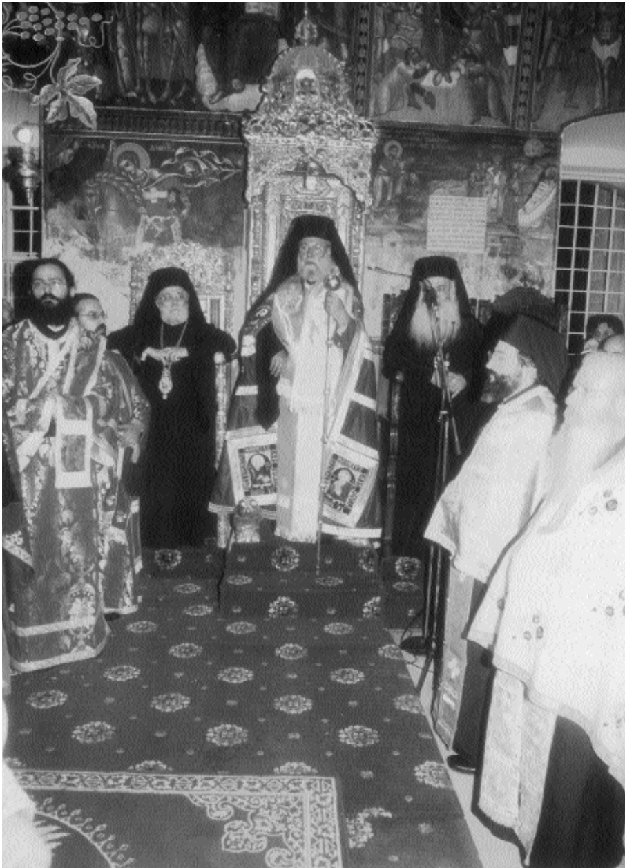
Ὁ Ἀρχιεπίσκοπος Χρυσόστομος χοροστατεῖ εἰς τόν καθεδρικόν ναόν τοῦ Ἀγ. Ἰωάννου τοῦ Θεολόγου κατὰ τόν ἑσπερινόν τῆς ἑορτῆς τοῦ Ἀγ. Ἰωάννου τοῦ Χρυσοστόμου.