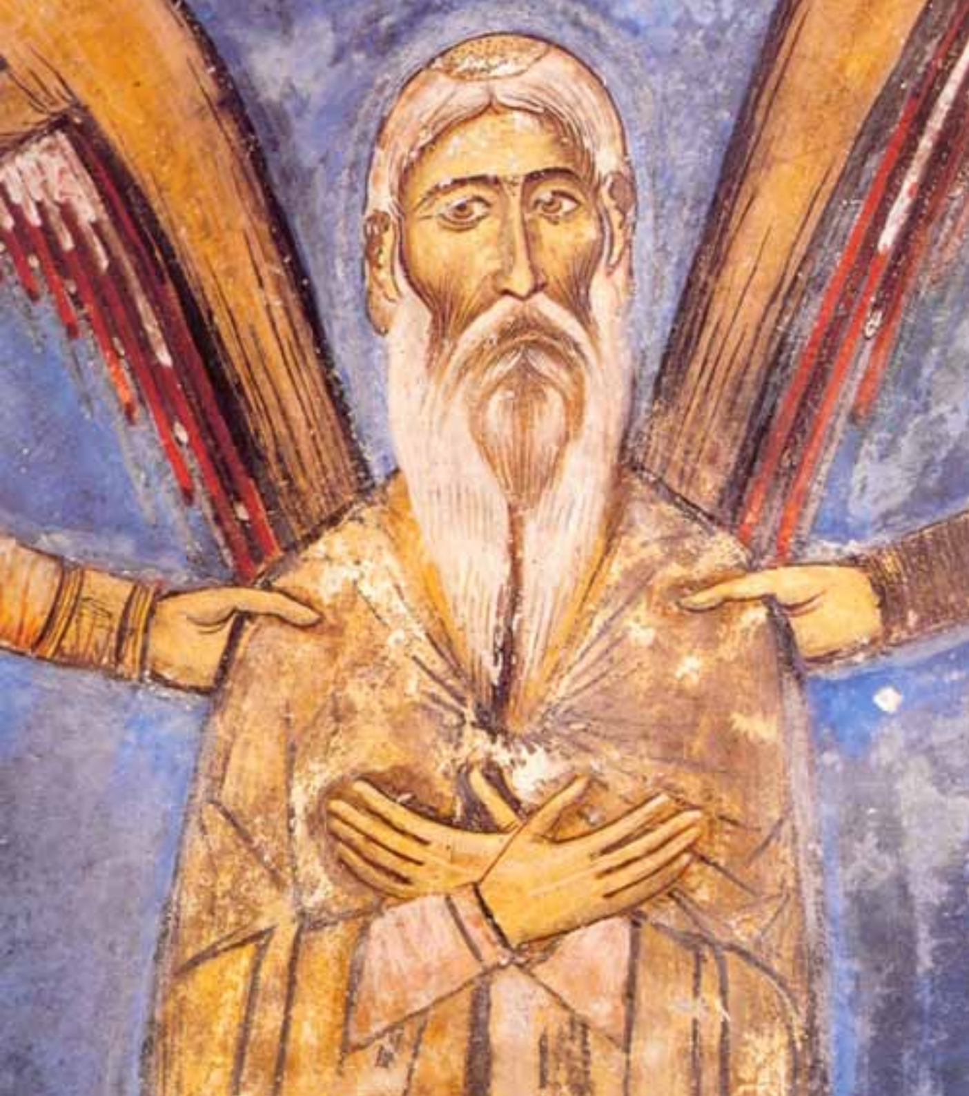
Άγιος Νεόφυτος ο Έγκλειστος (Τοιχογραφία 1183), Ιερό Εγκλείστρας, Μονή Αγίου Νεοφύτου, Πάφος