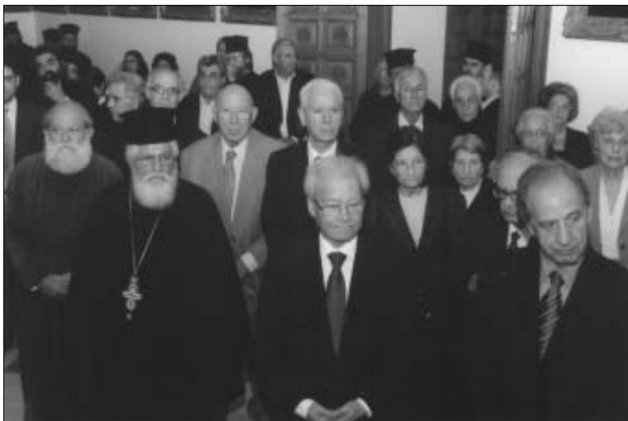
Μέρος τῶν παρισταμένων εἰς τήν τελετήν.