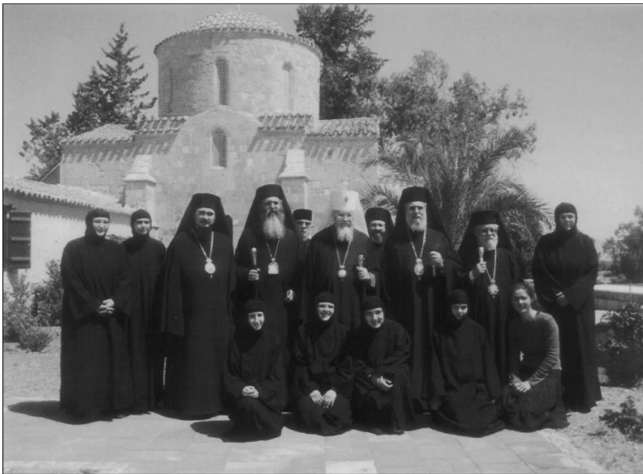
Οἱ Προκαθήμενοι τῶν Ἐκκλησιῶν Κύπρου καί Πολωνίας μέ τίς συνοδεῖες τους στή Μονή Ἀγ. Νικολάου παρά τήν Ὁρούντα.

διερμηνέυσσε στόν Πρόεδρο τῆς Δημοκρατίας τή συμπαράσταση τῆς Ἐκκλησίας τῆς Πολωνίας καί τῶν μελῶν της στόν ἀγῶνα πού διεξάγει ὁ Ἑλληνισμός τῆς Κύπρου. Ἀπό τήν πλευρά του ὁ Πρόεδρος τῆς Δημοκρατίας ἐνημέρωσε τόν Προκαθήμενο τῆς Ἐκκλησίας τῆς Πολωνίας γιά τίς προσπάθειες ἐπίλυσης τοῦ Κυπριακοῦ καί τήν πορεία τῶν συνομιλιῶν. Ἐπίσης, τόν ἐνημέρωσε γιά τήν καταστροφή τῆς πολιτιστικῆς μας κληρονομιάς στά τουρκοκρατούμενα ἐδάφη μας, τήν ὁποία χαρακτήρισε ὡς βαρβαρότητα, καί