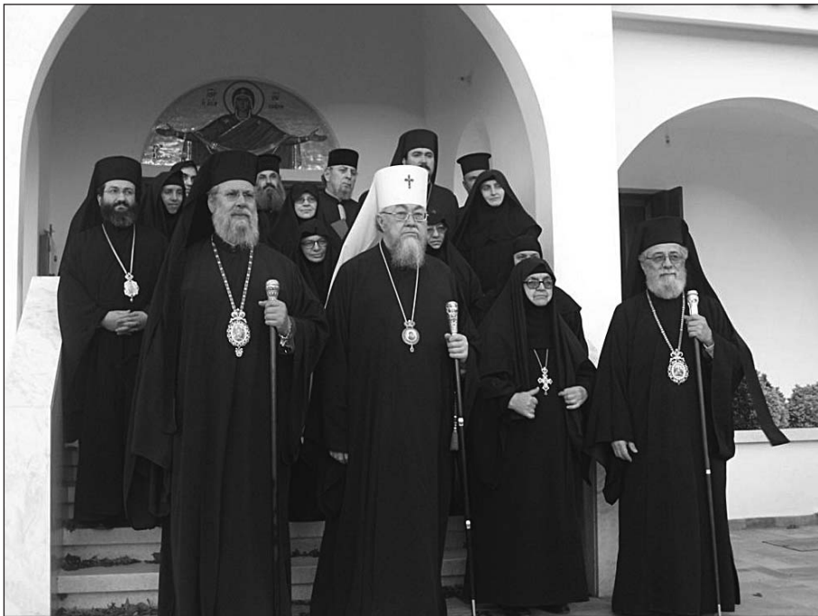
Ἀπό τήν ἐπίσκεψη στή Μονή Θεοτόκου στά Καμπίά.

Πρὶν τήν ἀναχώρησή του ἀπό τή Μονή, ὁ Προκαθήμενος τῆς