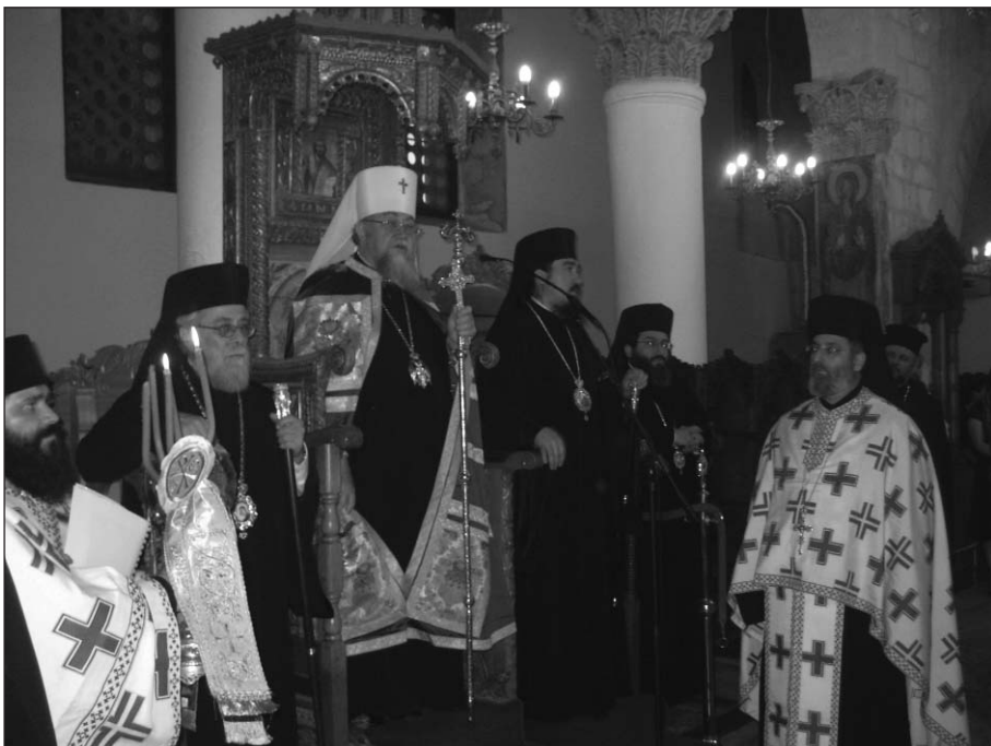
Ἀπό τή δέηση στή Μονή Ἀγ. Νεοφύτου.