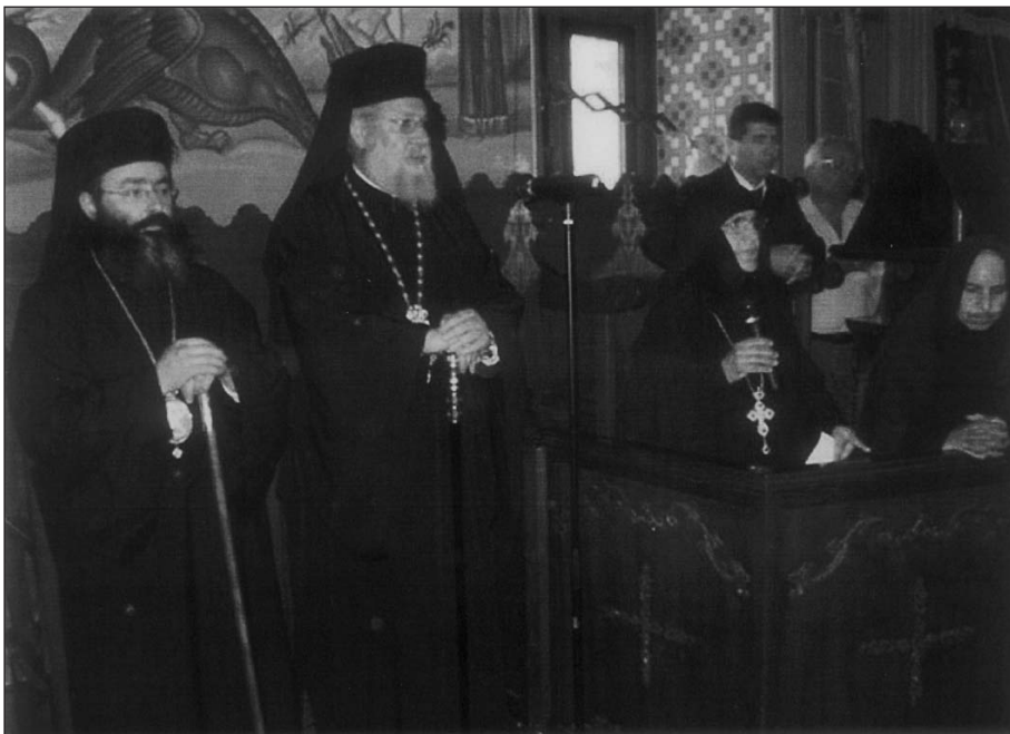
Ἀπό τήν ἐπίσκεψη στή Μονή Ἀγ. Γεωργίου Ἀλαμάνου.

Ἀκολουθῶς ὁ Πολωνίας Σάββας καί ὁ Ἀρχιεπίσκοπος Κύ- πρου, μέ τή συνοδεία τοῦ Χωρεπισκόπου Ἀμαθοῦντος κ. Νικολά- ου, μετέβησαν γιά προσκύνημα στή Μονή Ἀγ. Γεωργίου Ἀλαμάνου.