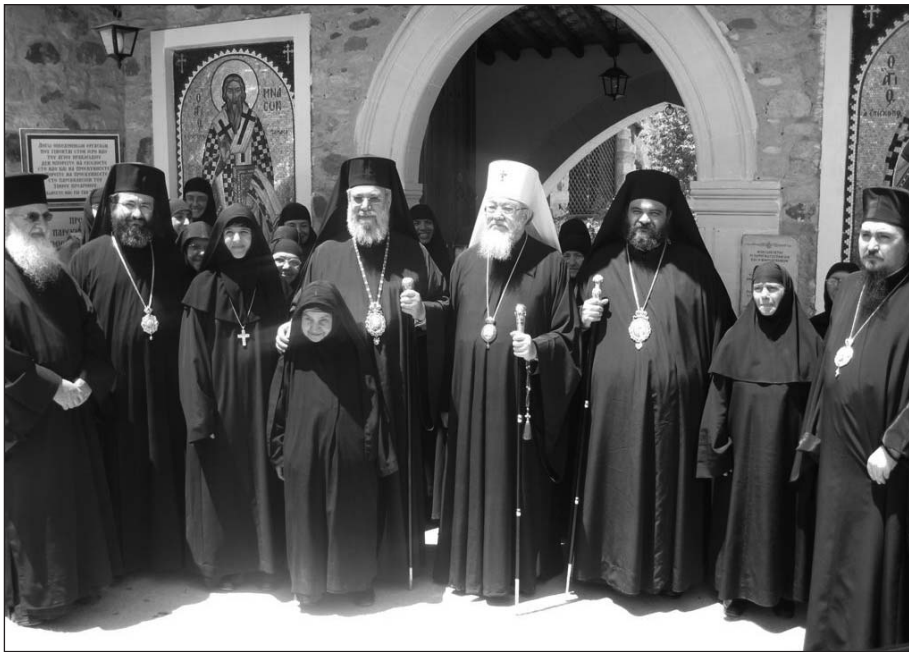
Ἀπό τήν ἐπίσκεψη στή Μονή Ἀγ. Ἡρακλειδίου.

«Χάρις στήν προσευχή τῶν μοναχῶν ὑπάρχει ἀκόμη αὐτός ὁ κόσμος, παρά τό γεγονός ὅτι εἶναι χωμένος μέσα στήν ἁμαρτία. Πρέπει νά ἔχουμε βαθιά συνείδηση αὐτοῦ τοῦ γεγονότος καί εἶναι στόχος ὅλων ἡμῶν τῶν Ὁρθοδόξων, σέ ὅλο τόν κόσμο, νά τό διατηρήσουμε», τόνισε.