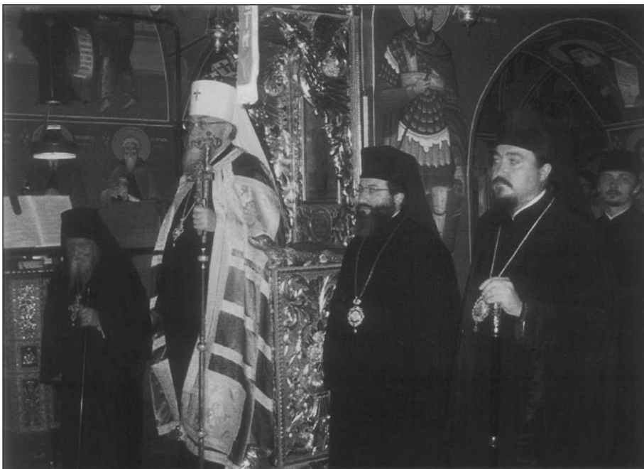
Ἀπό τή δέηση στή Μονή Σταυροβουνίου.

καί Πολωνίας, τό πρόβλημα τῆς Οὐνίας, ἀλλά καί γιά τόν ἐπικείμενο διάλογο κατά τήν Πανορθόδοξη Σύναξη στό Σαμπεζύ τῆς Ἑλβετίας. Ἀναφέρθη, ἀκόμη, στά προβλήματα τῆς Διασποράς καί ἐξέφρασε τήν ἄποψη, ὅτι δέν χρειάζομεθα ἄλλες διαιρέσεις. Μίλησε καί γιά τή σημερινή κατάσταση τῆς Ἐκκλησίας τῆς Πολωνίας, τῶν Μοναστηρίων καί τῶν Ἡσυχαστηρίων, ἀλλά