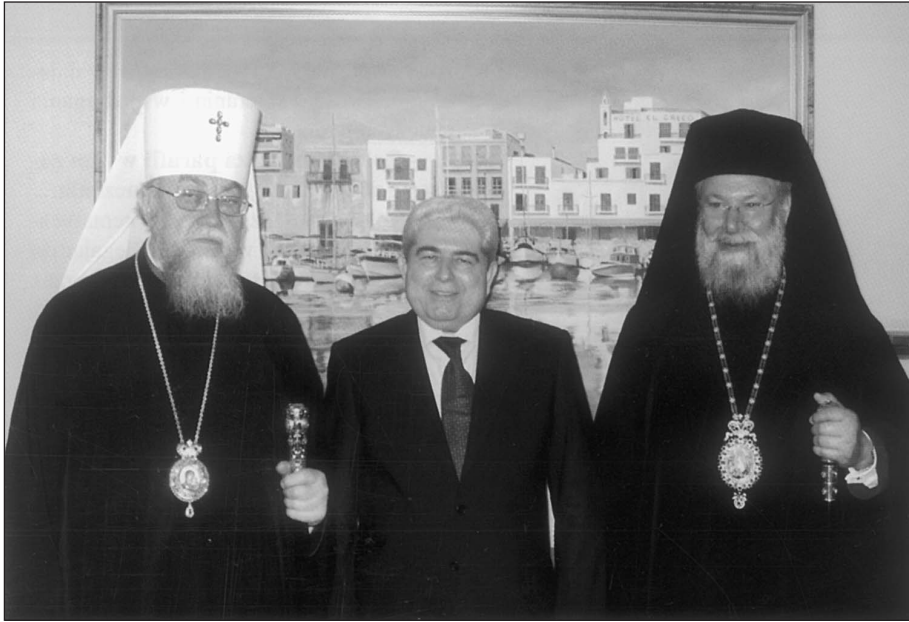
Οἱ Προκαθήμενοι τῶν Ἐκκλησιῶν Κύπρου καί Πολωνίας μέ τόν Πρόεδρο τῆς Κυπριακῆς Δημοκρατίας.