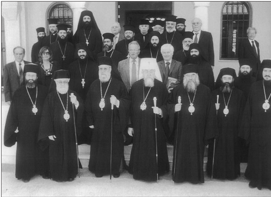
Οἱ Προκαθήμενοι τῶν Ἐκκλησιῶν Κύπρου καί Πολωνίας μέ τίς συνοδεῖες τους στήν εἴσοδο τῆς Μητροπόλεως Λεμεσοῦ.

τοῦ Ἀπ. Τυχικοῦ, ὡς πρώτου Ἐπισκόπου τῆς Νεαπόλεως, ὅπως ὀνομάζετο τότε ἡ Λεμεσός. Κάλεσε τό Μακαριώτατο Πολωνίας νά εὐλογήσῃ τόν εὐσεβῆ λαό τῆς Λεμεσοῦ καί τοῦ προσέφερε ὡς δῶρο εἰς ἀνάμνηση τῆς ἐπισκέψεως τήν εἰκόνα τοῦ Ἀγ. Ἰωάννη τοῦ Ἐλεήμονος, Πατριάρχου Ἀλεξανδρείας, πολιούχου τῆς πόλεως, ὁ ὁποῖος κατήγετο ἀπό τή Λεμεσό, ὅπου βρίσκεται καί ὁ τάφος του.