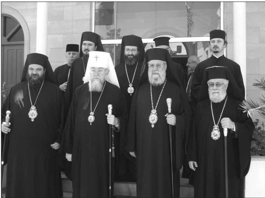
Οἱ Προκαθήμενοι τῶν Ἐκκλησιῶν Κύπρου καί Πολωνίας ἐξω ἀπό τή Μητρόπολη Ταμασοῦ.

Τό βράδυ ὁ Μακαριώτατος ἐπισκέφθηκε τόν Πρεσβευτή τῆς Πολωνίας κ. Pawel Dobrowolski, ὁ ὁποῖος καί παρέθεσε δεῖπνο πρός τιμήν του στήν Πρεσβευτική κατοικία.