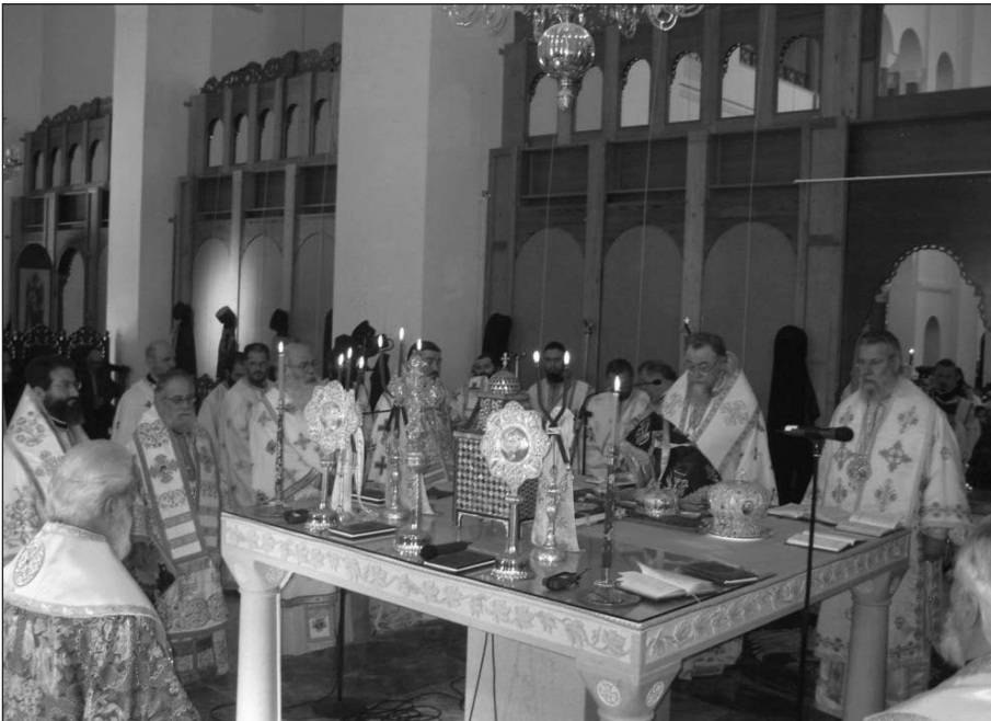
Ἀπό τό συλλεῖτουργο τῶν Προκαθημένων τῶν Ἐκκλησιῶν Κύπρου καί Πολωνίας.

Στήν Εὐρώπη ἀκούονται σήμερα καί φωνές πού ὑποστηρίζουν,