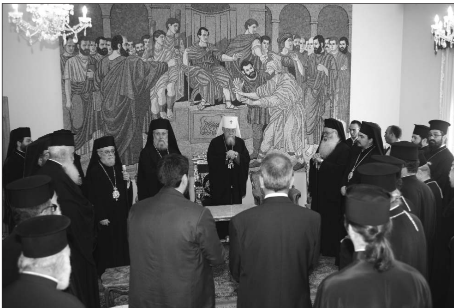
Ἀπό τήν ἐπίσκεψη στή Μητρόπολη Πάφου.

Τό πρωί τῆς Τρίτης, 19ης Μαΐου, ὁ Προκαθήμενος τῆς Ὁρθόδοξου Πολωνικῆς Ἐκκλησίας καί ἡ συνοδεία του ἐπισκέφθηκαν ἀρχαιολογικούς χώρους τῆς Πάφου (ψηφιδωτά, ναό Χρυσοπολίτισσας, στήλη Ἀπ. Παύλου κ.ἄλ.).